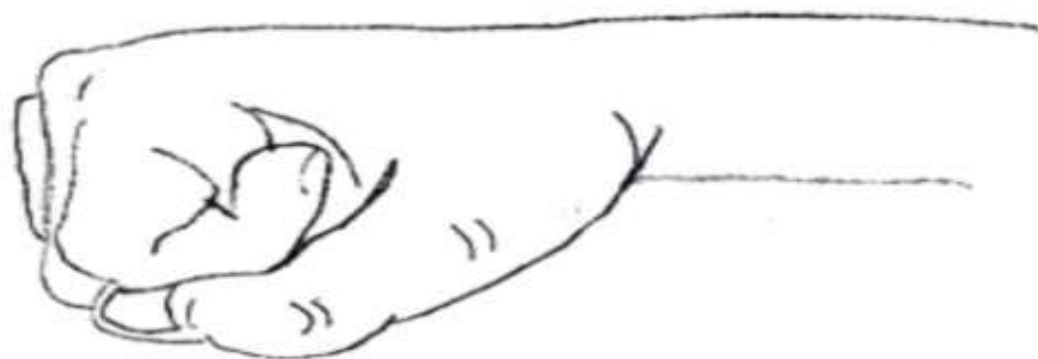
Ладонь, сжатая в кулак